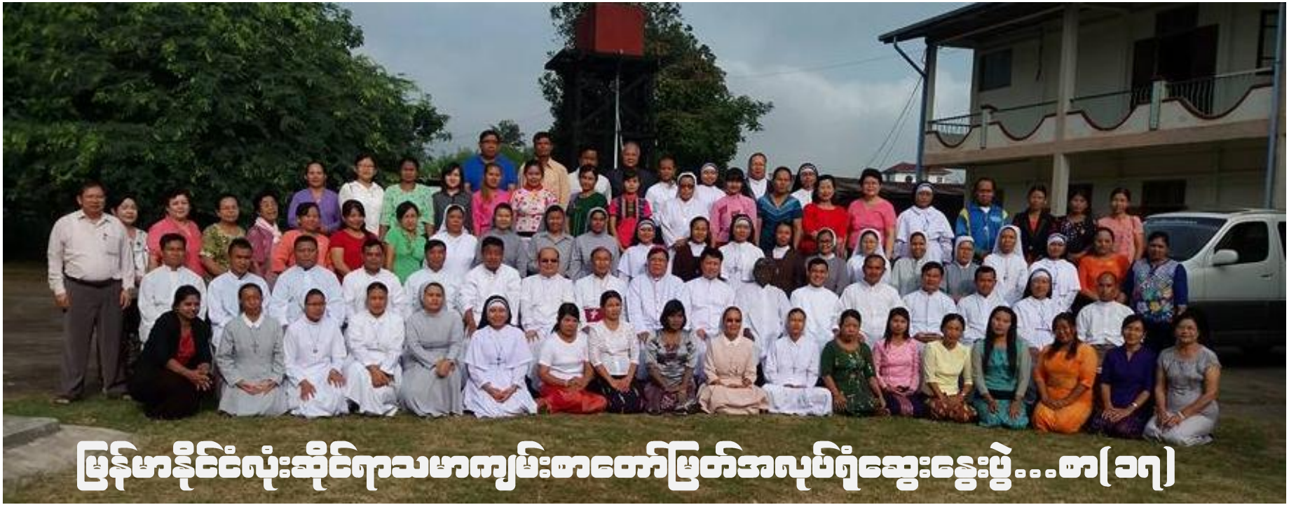
မြန်မာနိုင်ငံလုံးဆိုင်ရာသမာကျမ်းစာတော်ဖြတ်အလုပ်ရုံဆွေးနွေးပွဲ...စာ(၁၇)