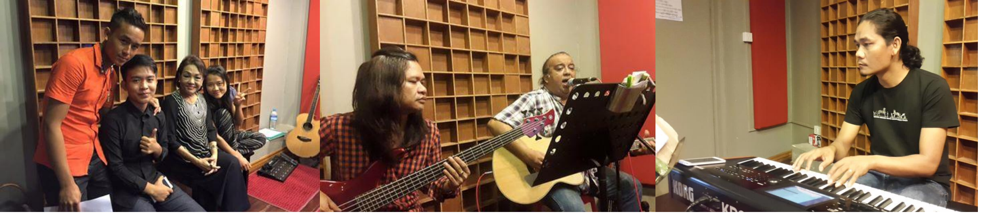
ထိုခွေများကို မြန်မာနိုင်ငံလုံးဆိုင်ရာ ကက်သလစ်ဆရာတော်ကြီးများအဖွဲ့ချုပ်တွင် ဖွင့်လှစ်ထားသော "STUDIO TRINITA" တွင် အသံသွင်းနေပြီဖြစ်ရာ မကြာမီ အချိန် တွင် ၎င်းဓမ္မတေးသီချင်းခွေကို မြန်မာနိုင်ငံလုံးဆိုင်ရာ ပြန်ကြားရေးနှင့်လူထုဆက်သွယ်ရေးရုံး (CBCM-OSC) ရုံးမှဖြန့်ချိပေးမည်ဖြစ်ကြောင်း ကြိုတင်သတင်းကောင်းပါးအပ် ပါသည်။

မြန်မာနိုင်ငံလုံးဆိုင်ရာ ပထမဦးဆုံးဓမ္မတေးသီချင်းဆိုပြိုင်ပွဲမှ ဆန်ကာတင် လက်ရွေးစင်ကိုဦးတို့၏သီချင်းအသစ်များကိုလည်း DVDတေးစီးရီးအဖြစ် ထုတ်လုပ် နေပါသည်။ ထို့အပြင် ခရစ္စမတ်တေးသီချင်းများကိုလည်း မြန်မာနိုင်ငံ ကက်သလစ်အနု ပညာရှင်များအဖွဲ့အစည်း(CCAA)မှ တေးသံရှင်များ မှ သီဆိုပုံဖော်ကာ ထုတ်လုပ်မည် ဖြစ်ပါသည်။