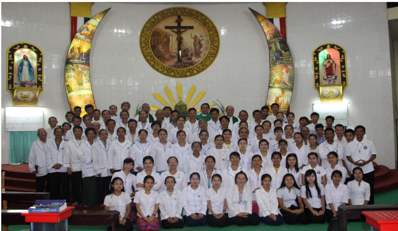
ဓမ္မဆရာ၊ ဆရာမများ နှစ်ပတ်လည်ဝတ်စောင့်ခြင်းနှင့် ဖွမ်းမံသင်တန်း...စာ(၁၇)