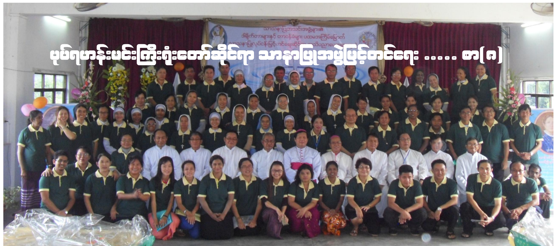
ပုဂံရဟန်းမင်းကြီးရုံးတော်ဆိုင်ရာ သာနာဖြူအဖွဲ့ဖြင့်တင်ရေး...စာ(၈)